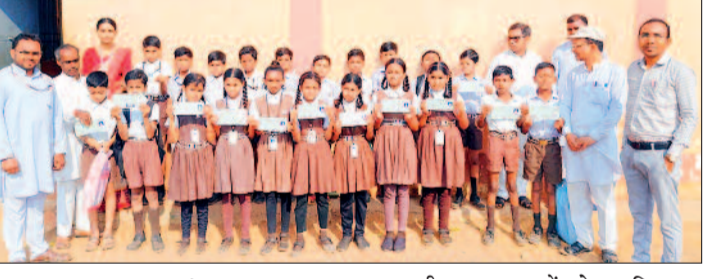
हरिभूमि न्यूज ▶▶ डौंडीलोहारा